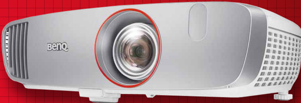
FANTASTIC MATCH ภาพใหญ่เต็มตาเต็มมอรรถรส สนุกกว่าเล่นบนจอทีวีเยอะ อย่างชนิดเทียบกันไม่ได้

อันดับต่อไปคือ FIFA 16 แอ็คชั่นบนสนาม ลื่นไหลไร้อาการหน่วงหรือสะดุดให้เสียอารมณ์ นักเตะเคลื่อนไหวอย่างเป็นธรรมชาติ เลี้ยงบอล ได้พลิ้วไหวสมจริง การจับบอลและจ่ายบอล ดูสมูทเนียนตา รายละเอียดต่างๆ สวยคมชัด ความรู้สึกในการเล่นเกมนฟุตบอลด้วยภาพใหญ่โต นั้นสนุกอย่างที่เราไม่เคยคาดคิดมาก่อน เรียกว่า อลังการงานสร้างได้อย่างเต็มปาก มันทำให้เรา อินไปกับการแข่งขันทุกเสี้ยววินาที