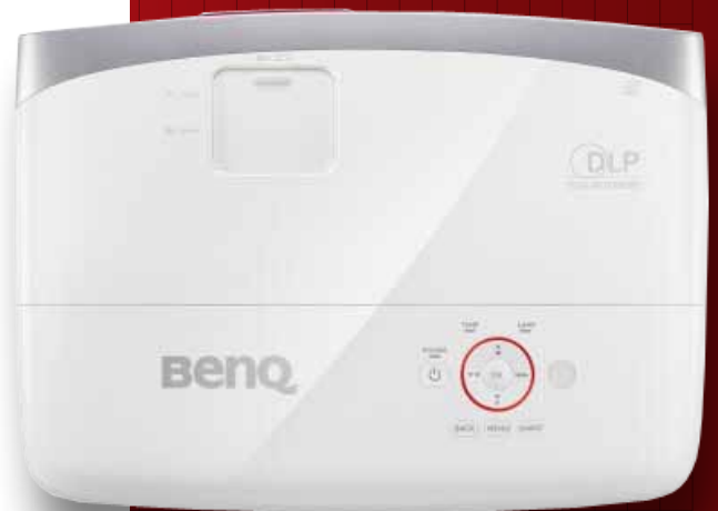
TOP VIEW ปุ่มควบคุมสำหรับใช้แทนรีโมท พร้อมแผงปรับซูมและไฟกึ่ง ซ่อนอยู่ใต้ฝาปิดเหนือเลนส์

ข้อด้อย บางครั้งเวลาดูภาพยนตร์มีสีรุ้งเล็กน้อย ในฉากที่สว่างๆ ต้องซื้ออุปกรณ์เพิ่มถ้าอยากลดริบ ภาพยนตร์เบียร์สาย ความเห็นของ T3 เกมเมอร์ไม่ควรพลาดโปรเจคเตอร์ ตัวนี้เด็ดขาด ราคาคุ้มค่าถือว่ายอดเยี่ยมสำหรับ ภาพขนาดมหึมาพร้อมคุณภาพที่ออกเลยว่ายเยี่ยม จริงๆ เป็นทำให้เกมสนุกตื่นเต้นกว่าการเล่นบนจอทีวี อย่างชนิดเทียบกันไม่ได้