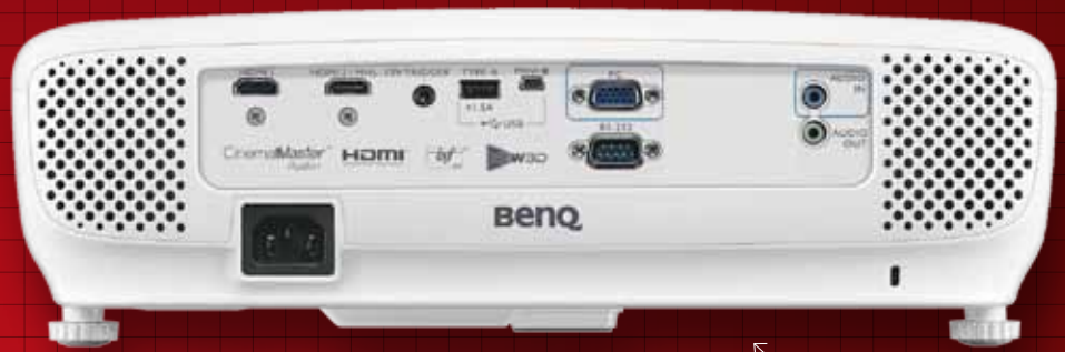
BACK VIEW สารพัดช่องต่อครอบคลุมทุกการใช้งาน HDMI สองช่อง หนึ่งในนั้นรองรับ MHL

W1210ST ทำให้เกม สนุกตื่นเต้นกว่าการเล่น บนจอทีวีอย่างชนิดที่ เทียบกันไม่ได้เลย